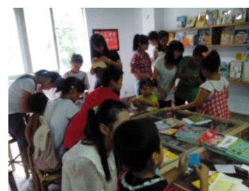
金山社区大学“蒲公英课堂”