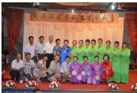
关源社区中秋文艺联欢会