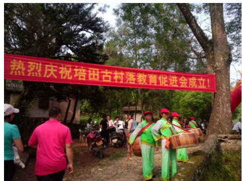
培田古村落教育促进会成立

厦门国仁社区大学： 如期开展了两次国仁讲坛，顺利开展了工友创业大赛、“缘来是你”社交小组、儿童博饼等活动。