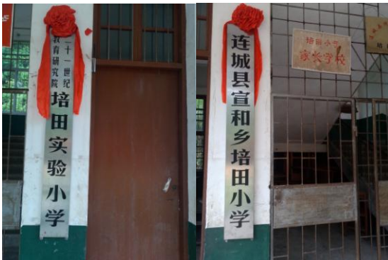
21世纪教育研究院培田实验小学揭牌成立

培田客家社区大学： 推动成立了“21世纪教育研究院培田实验小学”及“培田古村落教育促进会”。