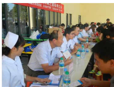
正荣·大湖之都中秋义诊