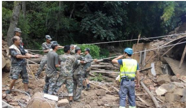
绿洲应急队员与部队官兵协作利用 SRT 技术拆除危房

1. 生命救援；2. 灾情信息采集；3. 救灾物资转运及发放；4. 解决灾民饮用水安全问题；5. 大众卫生防疫及消杀。