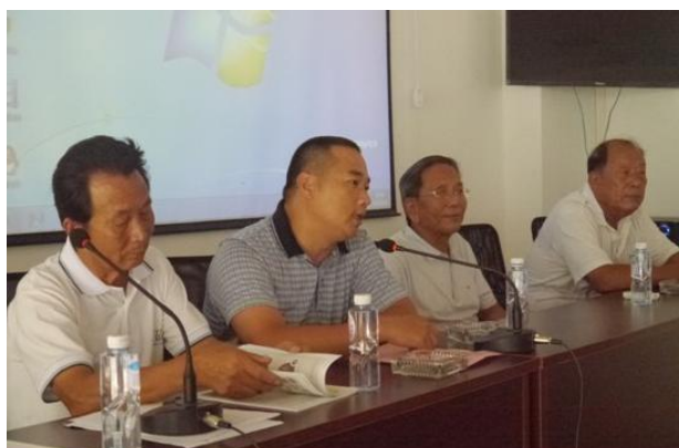
汀塘村欧书记在会上发言