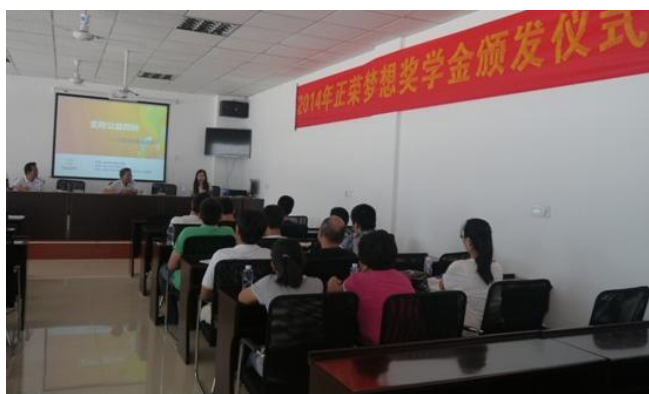
2014年“正荣梦想奖学金”颁发现场

由正荣集团委托正荣公益基金会颁发，首批13名即将踏进大学校园的家乡学子获得奖励，资助金额达4.3万元。