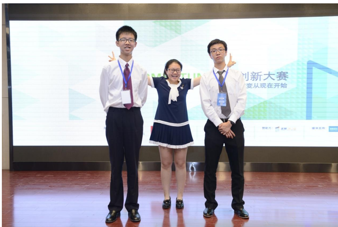
“拓荒者”团队：关注家庭厨余垃圾的绿色处理，推广堆肥桶进入家庭，并创新使用有机肥置换有机蔬菜的良性循环模式。