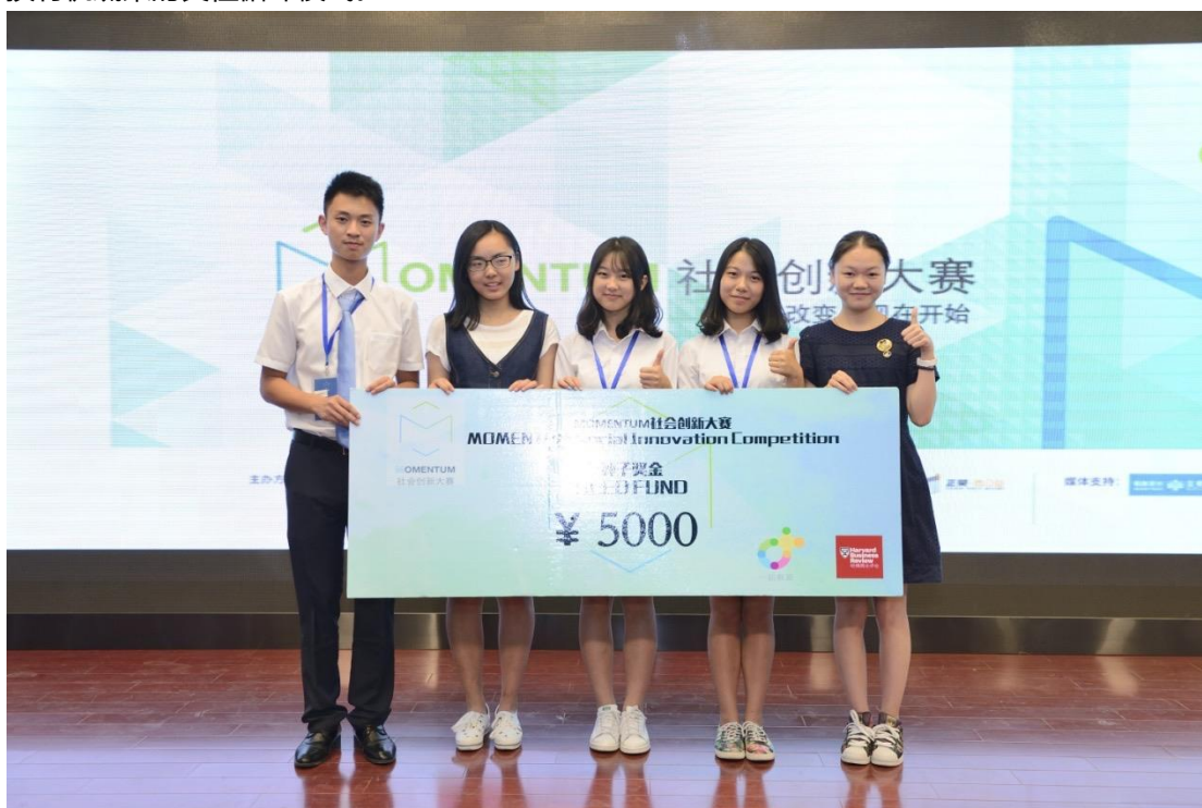
“Wa! Pulse”团队：从身边的高中生新生社交障碍问题进行突破，他们设计出“破冰”的完整内容体系帮助青少年团体快速融入集体生活，操作性与推广性都恰到好处。