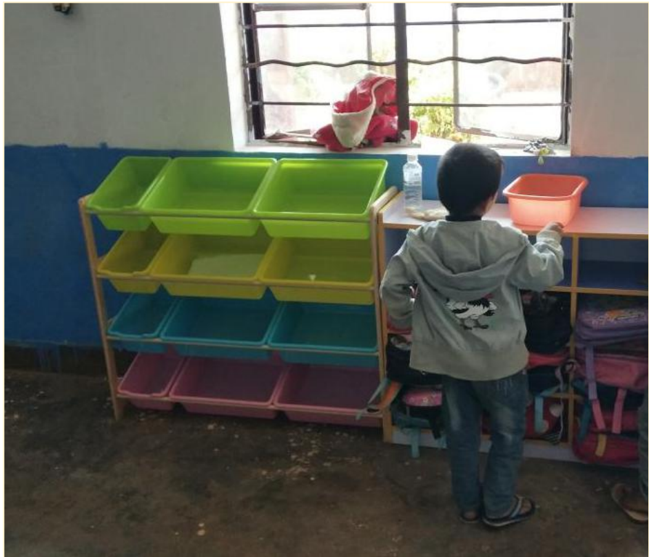
象转坝幼儿班玩教具配备