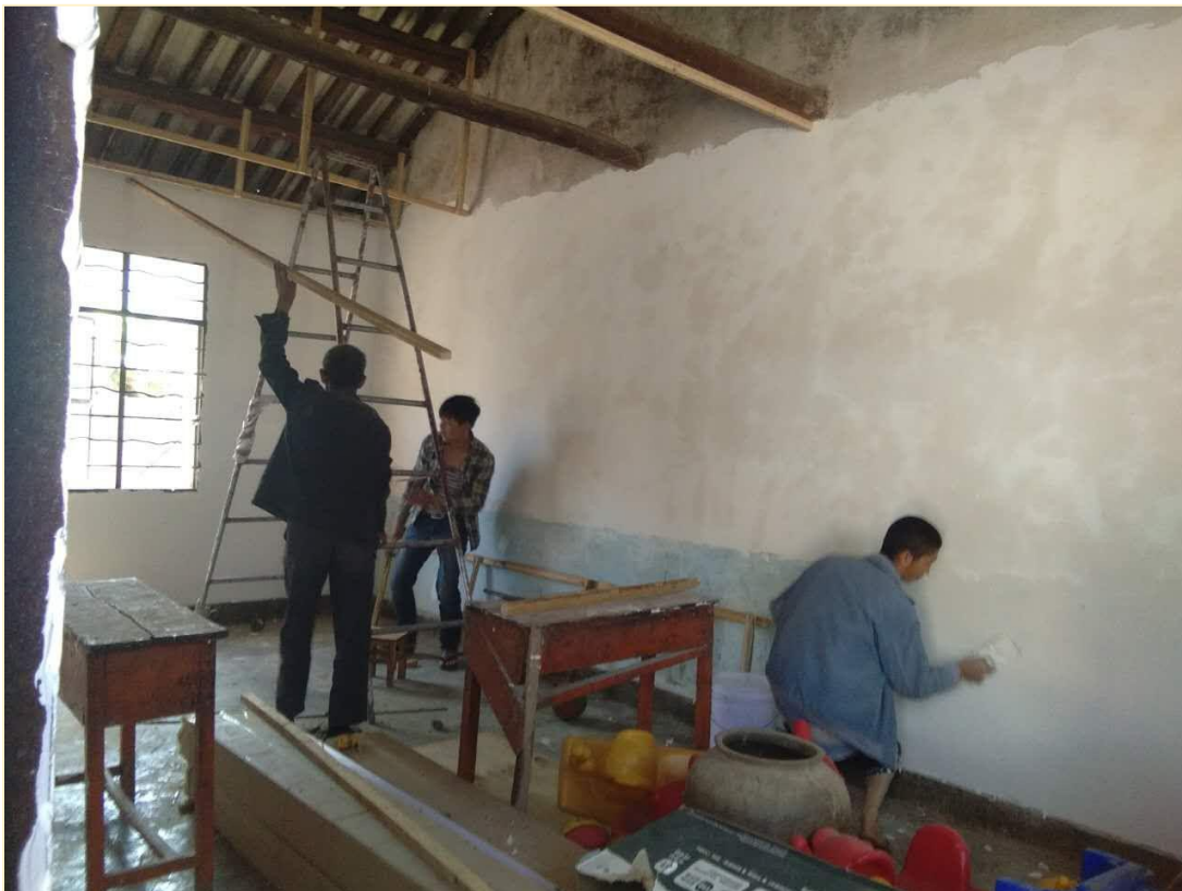
塘铁寨幼儿班教室修缮施工中