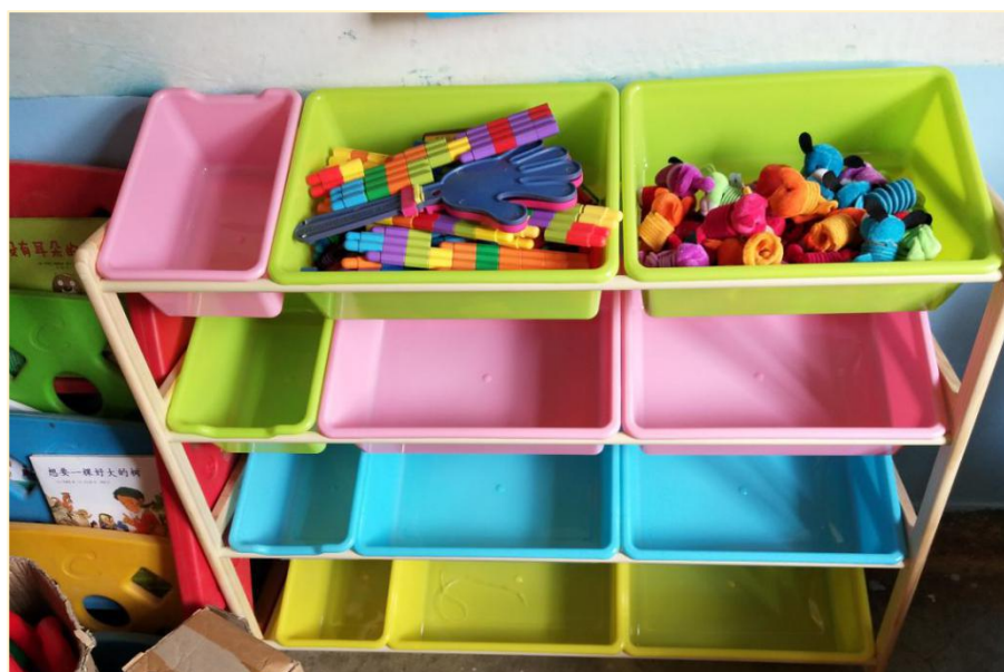
塘尚水幼儿班玩教具配备