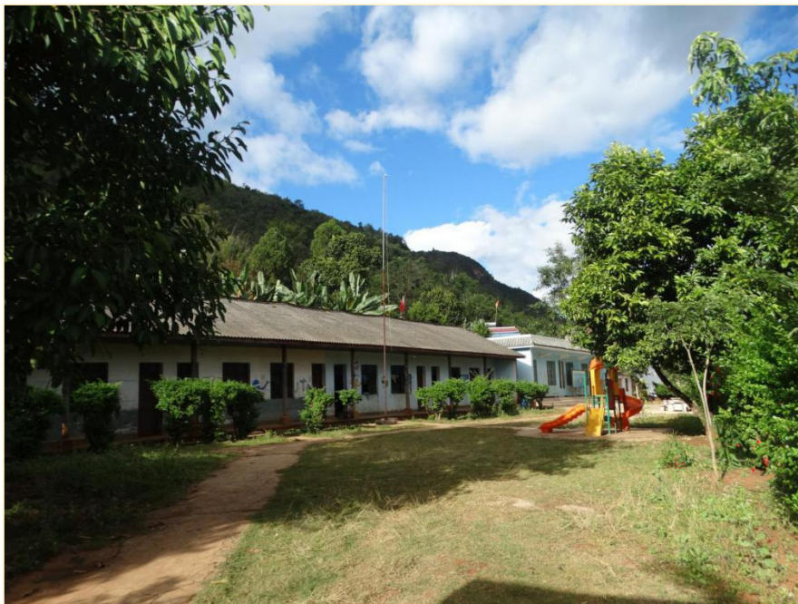
象转坝幼儿班修复前