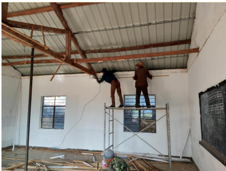
象转坝幼儿班教室修复施工中