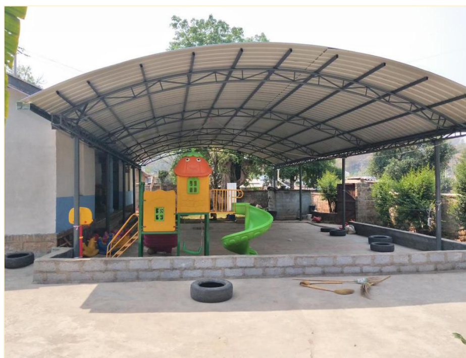
塘铁寨幼儿班校舍修复后