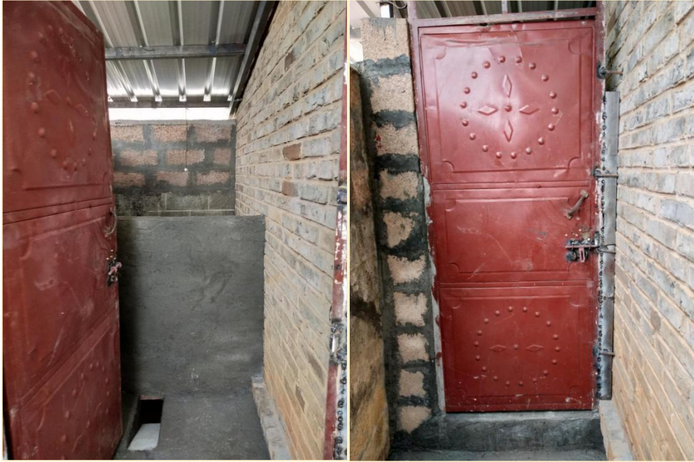
塘尚水幼儿班幼儿班新建的校内厕所