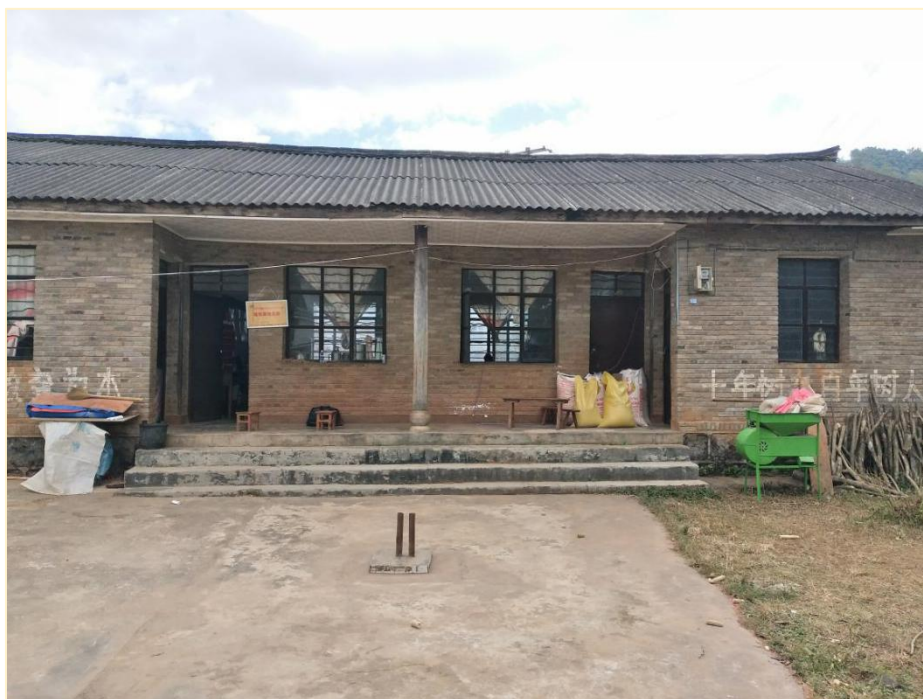
塘铁寨幼儿班校舍修复前