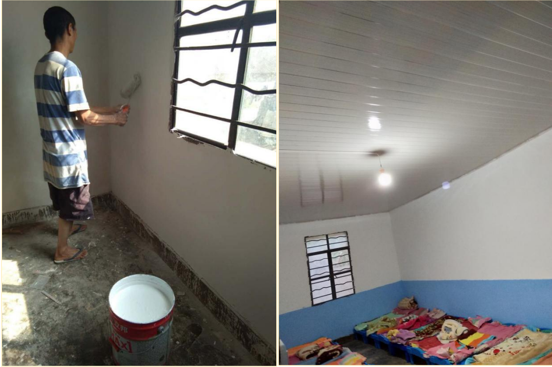
塘铁寨幼儿班的午休室前后对比