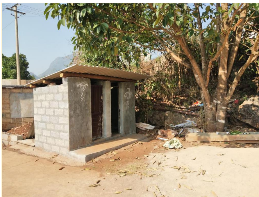
象转坝幼儿班校园内新修建的厕所