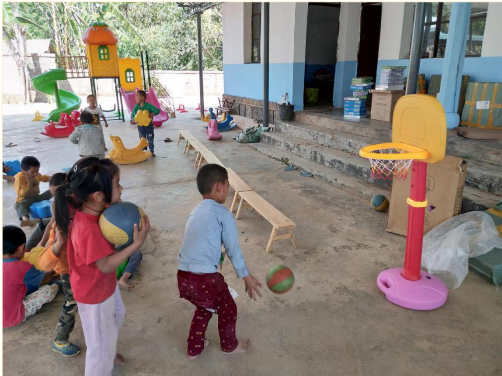
塘铁寨幼儿班玩教具配备