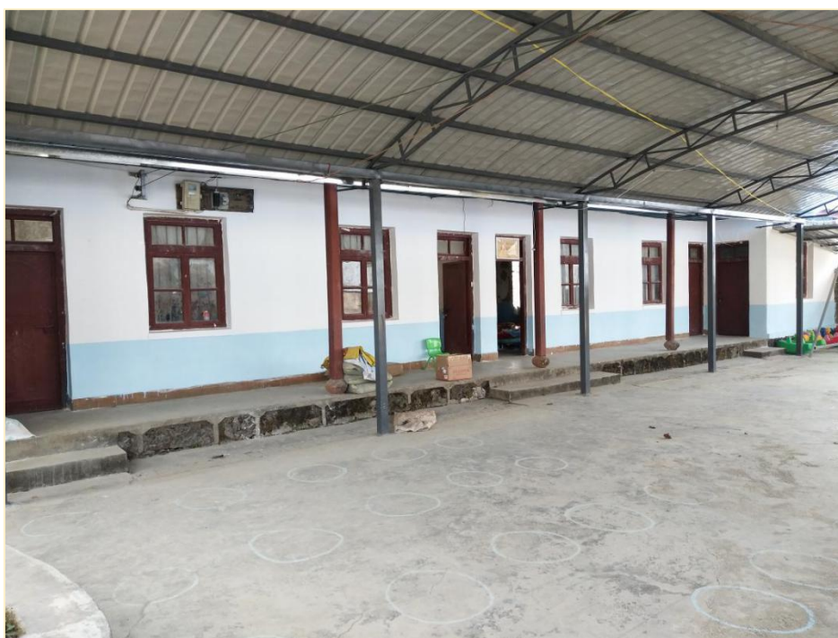
塘尚水幼儿班校舍修复后