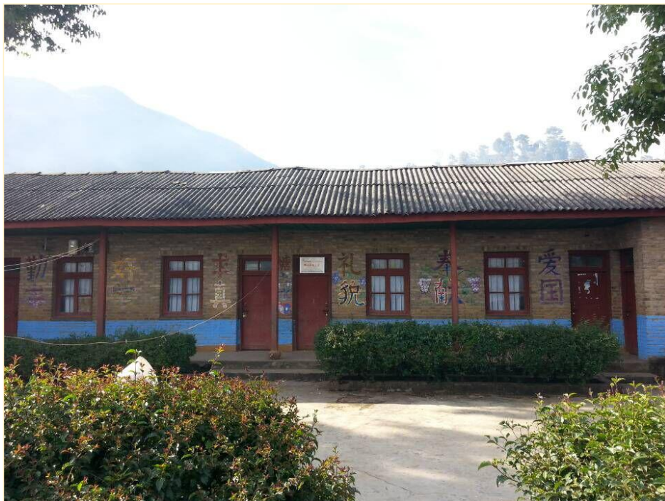
塘尚水幼儿班校舍修复前