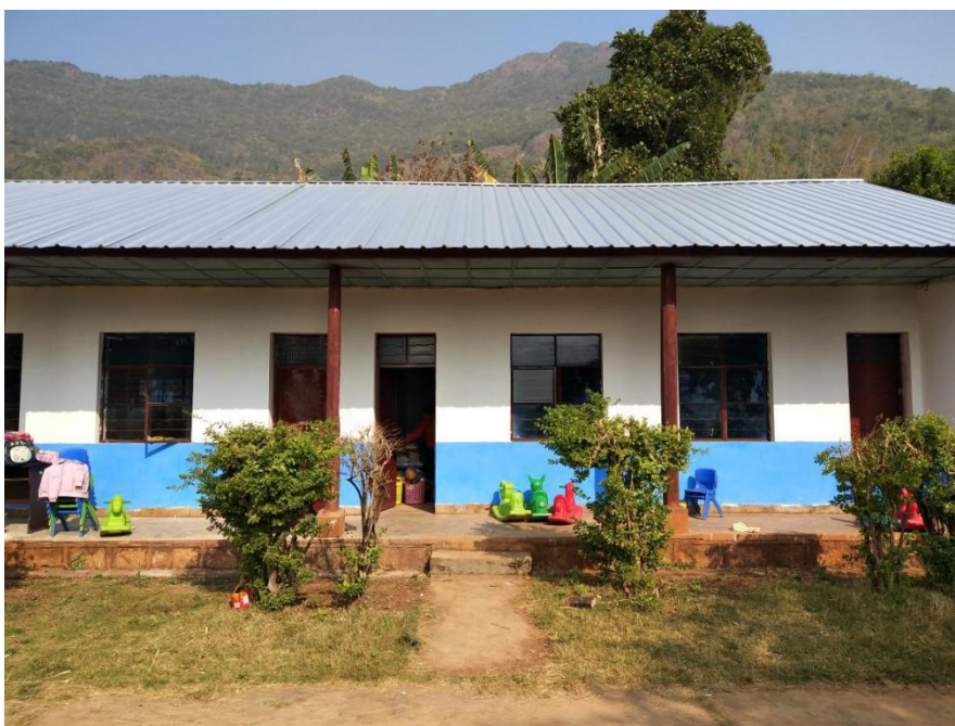
象转坝幼儿班修复后