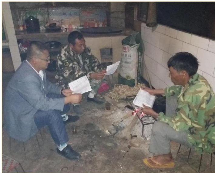
幼儿班委员会会议：讨论校舍修复