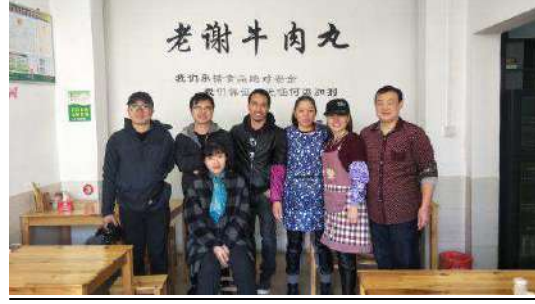
在长汀采访返乡创业者