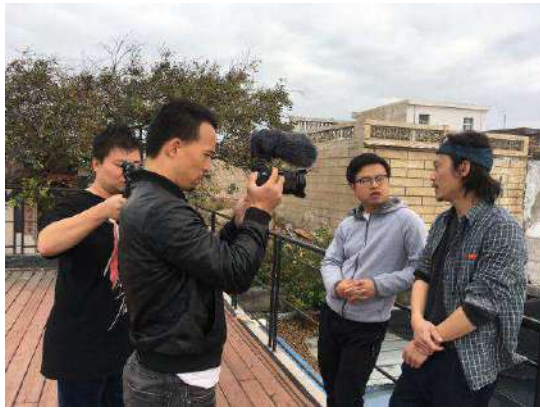
在东山岛采访民宿老板