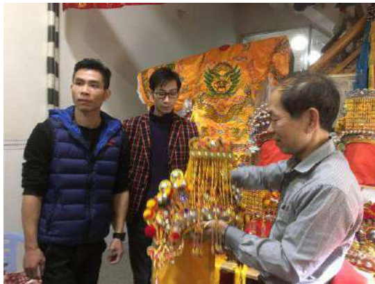
在漳州采访戏剧头盔制作手艺人