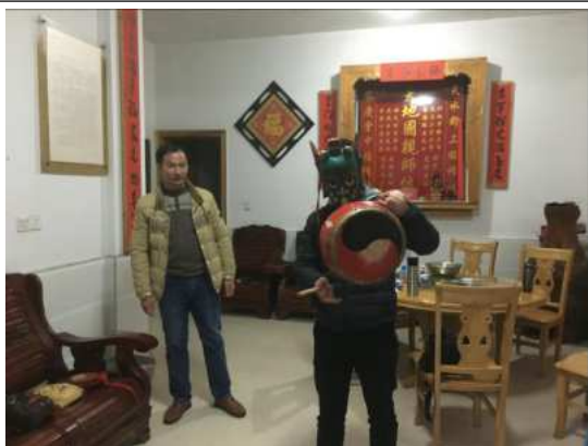
在泰宁大源村采访傩舞传人