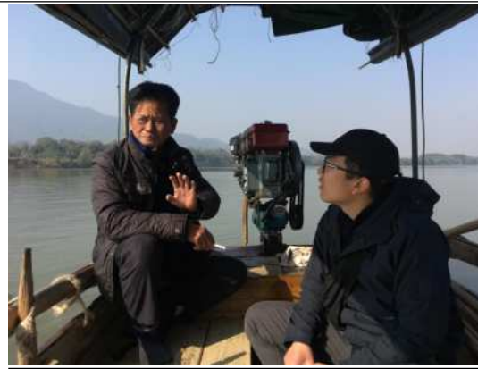
在漳州九龙江采访渔民