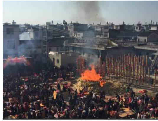
在漳州拍摄千人祭祀庆典