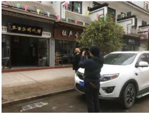
在浦城采访闽派古琴传人