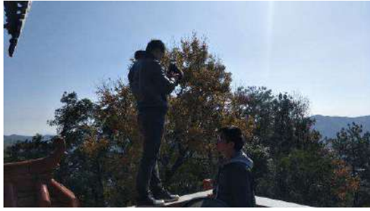
在长汀拍摄古城旧址