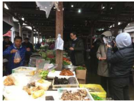
在武夷山拍摄圩市