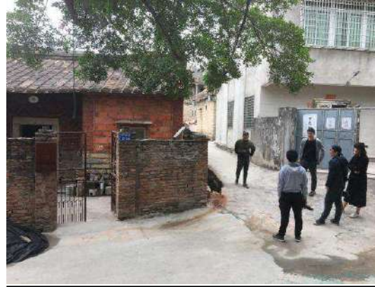
在厦门采访驻村艺术家