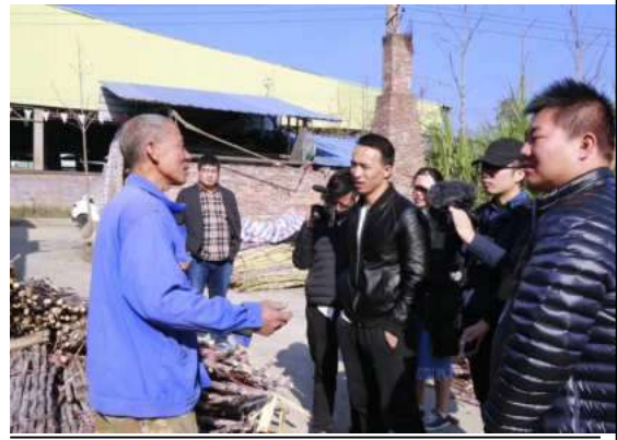
在福安采访古法红糖手艺人