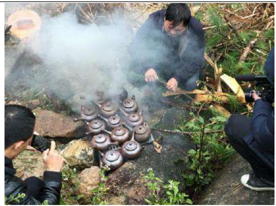
在将乐拜访山里的养壶人