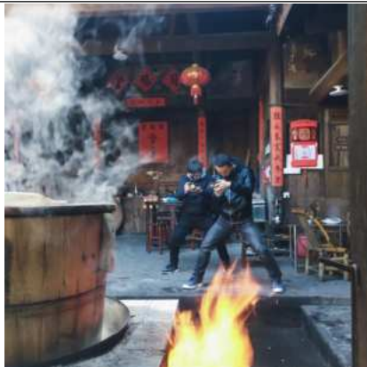
在连城芷溪村拍摄客家米酒酿造