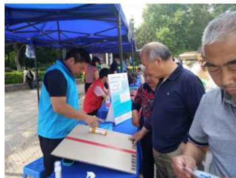
3. “创益为儿童”六一历下创益园园区开放日