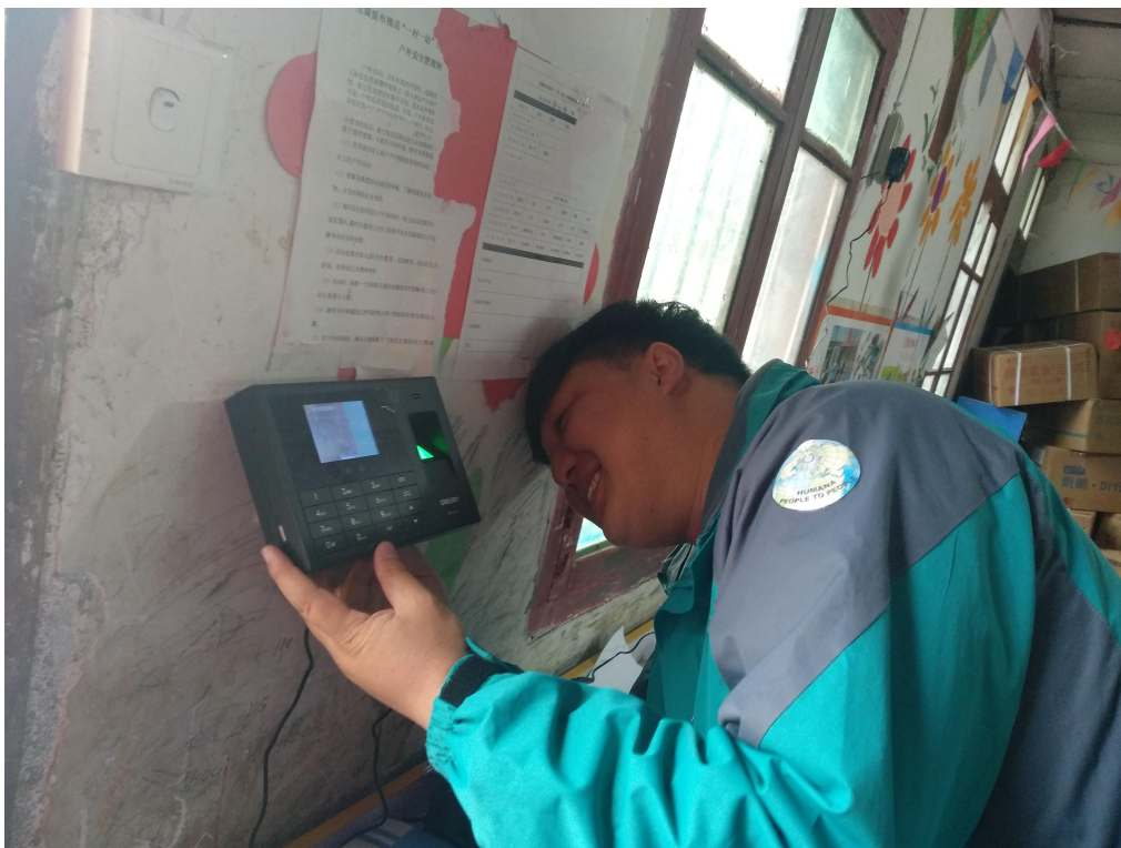
在布拖项目地安装针对教师的考勤系统

在此项目期间，捐资管理部还调研了使用考勤系统、平板电脑、微信小程序以提升项目管理效率的可行性。