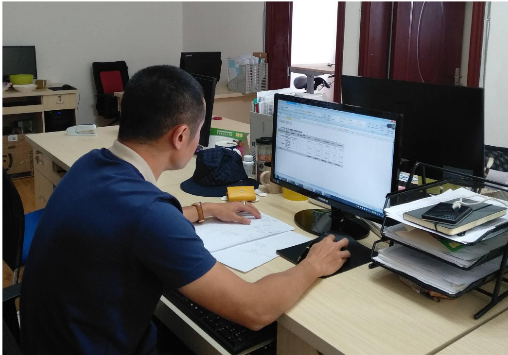
捐资管理部工作现场