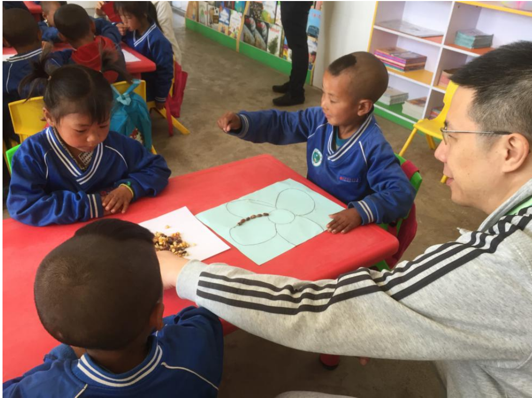
上图 - 马南信托基金和福慧基金会拜访四川省凉山州布拖县幼儿班项目

下图 -2018年5月29日，国家级和省级的性艾协会、妇幼中心和卫计委参加了互满爱在昆明举办的工作研讨会，参会人员走访了互满爱云南代表处昆明办公室，全面地了解互满爱中国和 TCE 项目运作情况