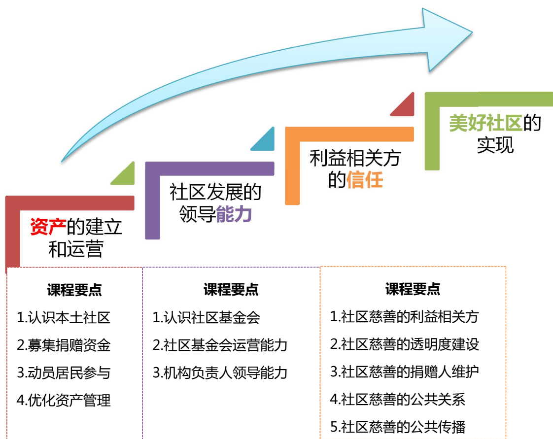
图 2：课程架构及要点设置