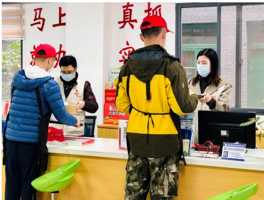
2) 2020 年 5 月 13 日举行本年度第一季度生日会