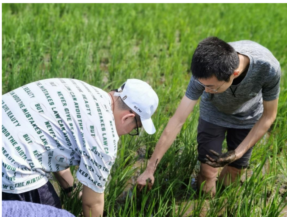
8) 6月20日森林公园社会实践与徒步