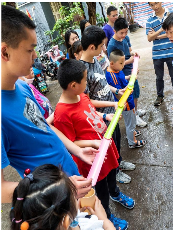
5) 2020 年 6 月 25 日端午节包粽子体验活动