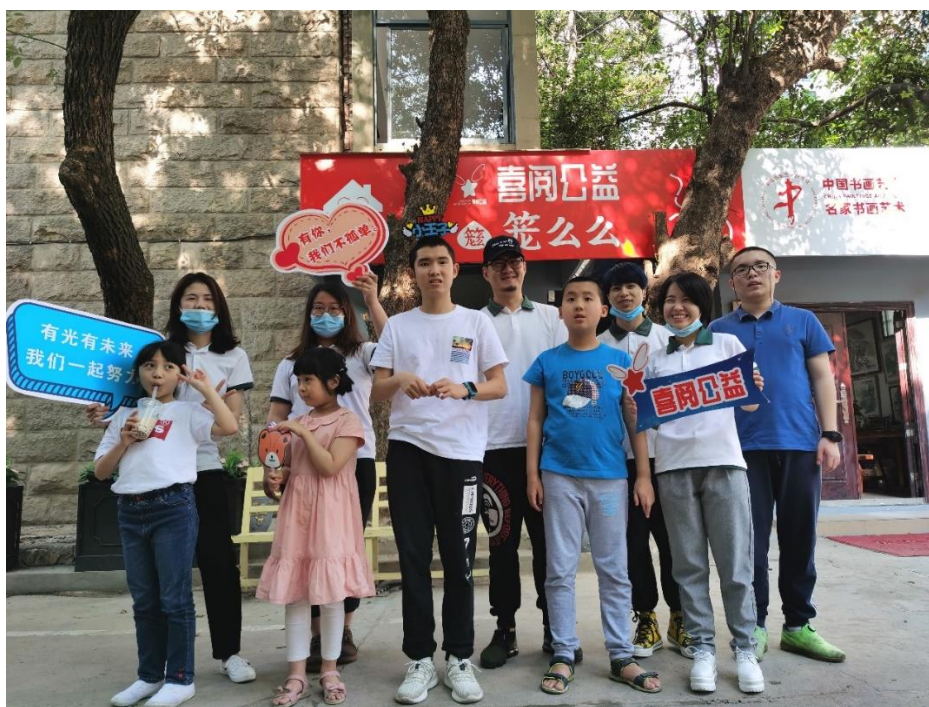
3) 2020 年 5 月 28 日举行社区融合与慰问活动