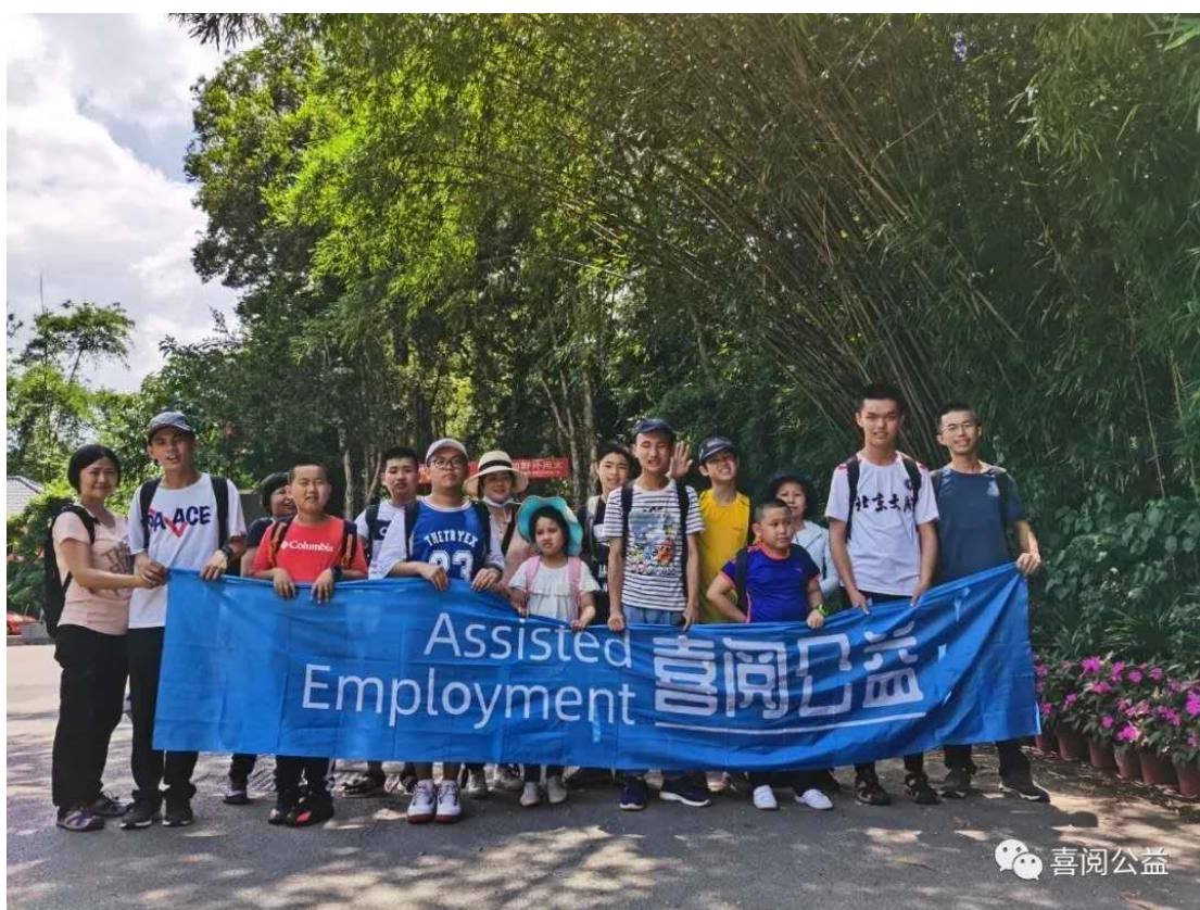
9) 2020 年 7 月举办心智障碍者夏令营，参加者为 12 个心智障碍家庭，历时 5 天，在周宁