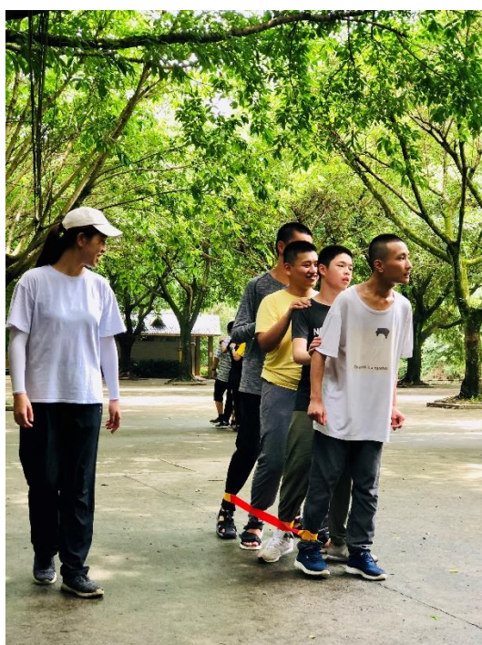
7) 6月15日前往闽清尾洋农场社会实践