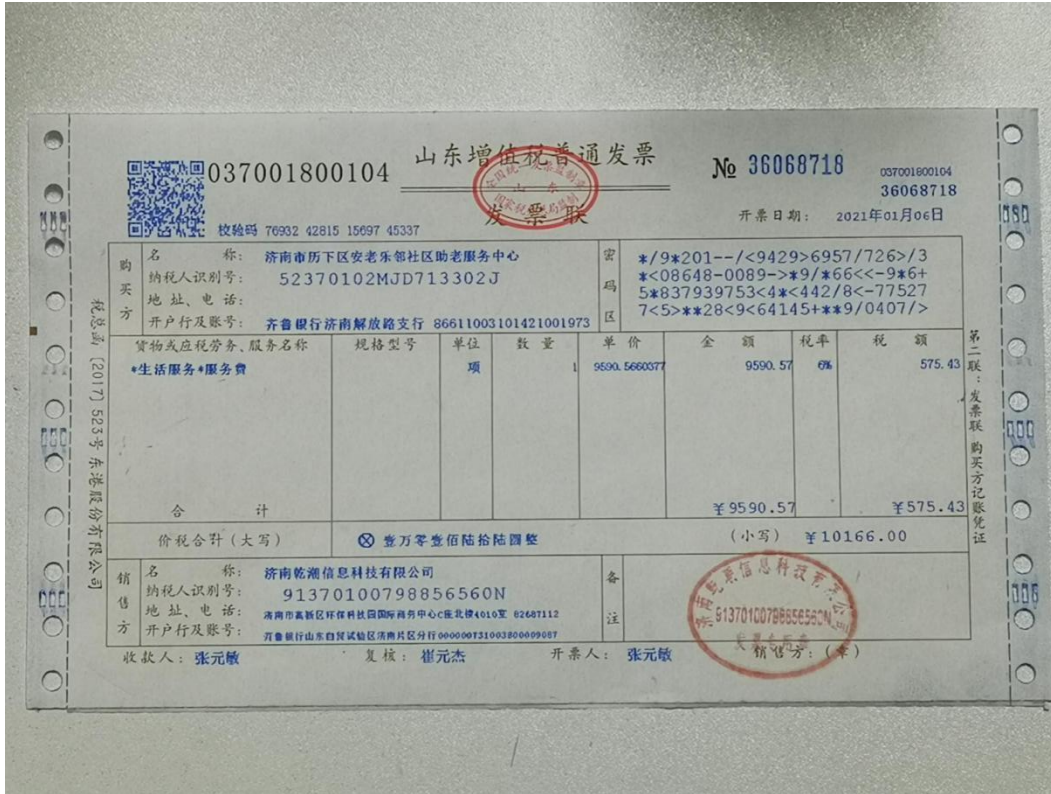
2、5月份两名志愿者服务补贴