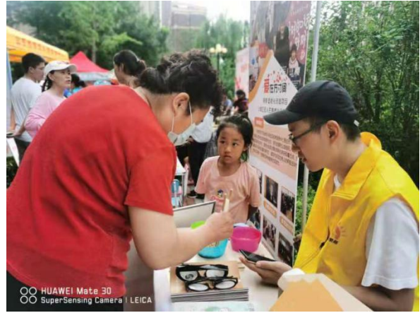
4、2020. 10. 24 康和西苑小区公益市集