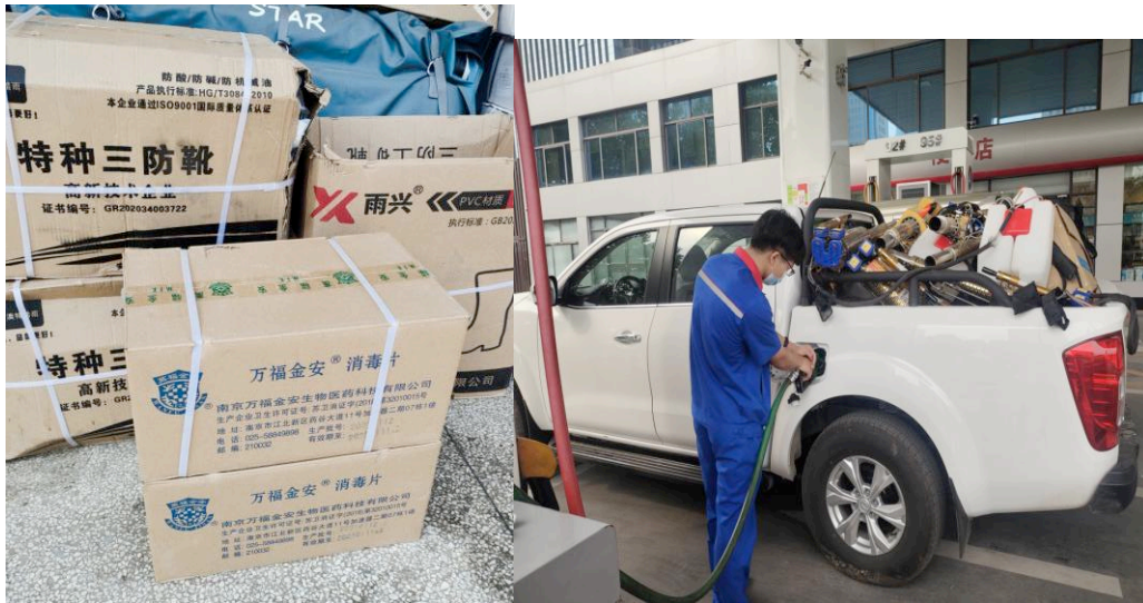
(由正荣公益基金会资助资金购买的消毒片)