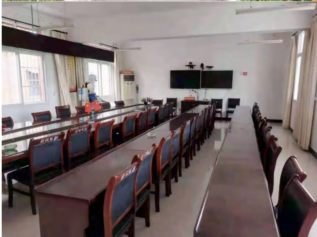
消杀组在金河镇展开消杀防疫工作，室内室外，角角落落全面消毒。