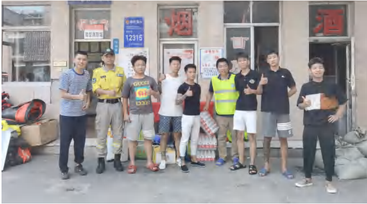
(在新乡宾馆，群众送来三箱矿泉水)