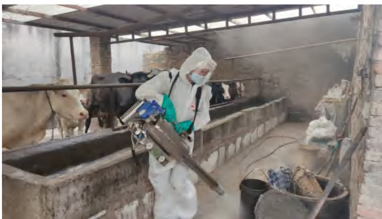
(绿舟队员在对养殖场进行消杀)