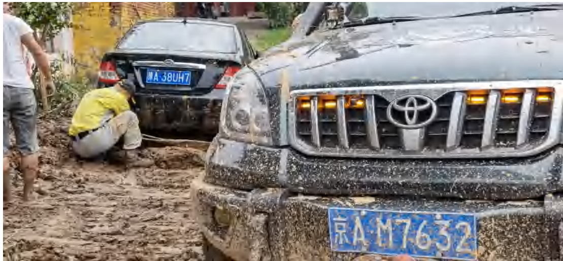
（绿舟应急队员正在解救被困车辆）

22日凌晨6:30分，第二梯队与两小时前到达的第一梯队汇合，顾不上休息，就直接开始了救援行动。