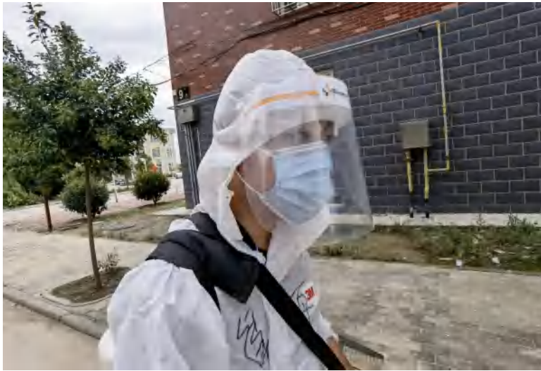
(全副武装的绿舟队员)