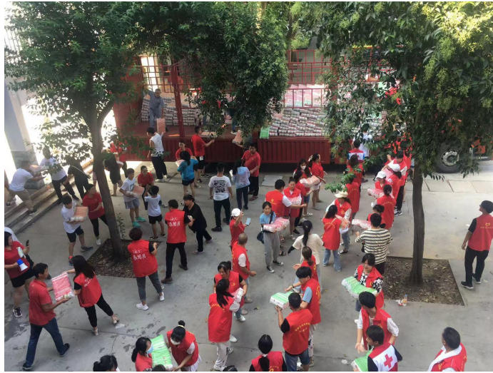
招募本地志愿者下载救援物资