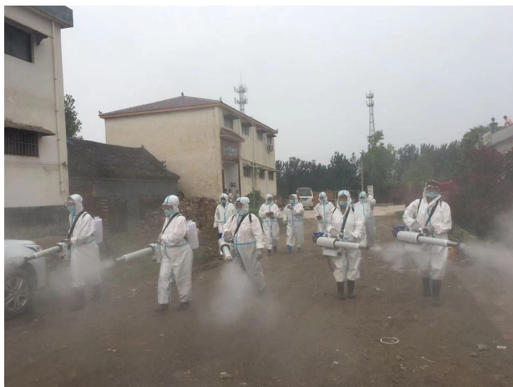
志愿者在赵固镇东樊村开展消杀工作